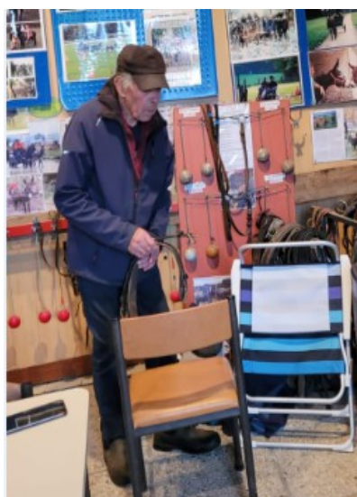
(Gérard en pleine effervescence - murs tapissés de la salle d'accueil)

Je termine le stage ravie d'avoir réussi à passer le galop 5 pour reprendre l'attelage et d'avoir fait de belles rencontres, et très motivée à continuer de progresser. Et bien entendu, avec la hâte de revenir !