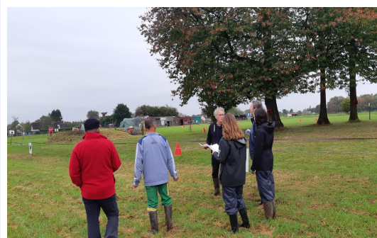
( Stagiaires tentant de s'orienter sur l'espace de dressage )

Alain et Lise me proposent gentilement, à leur propre initiative, de me laisser Éclair pour le reste du stage et préserver son énergie pour le jour de l'examen.