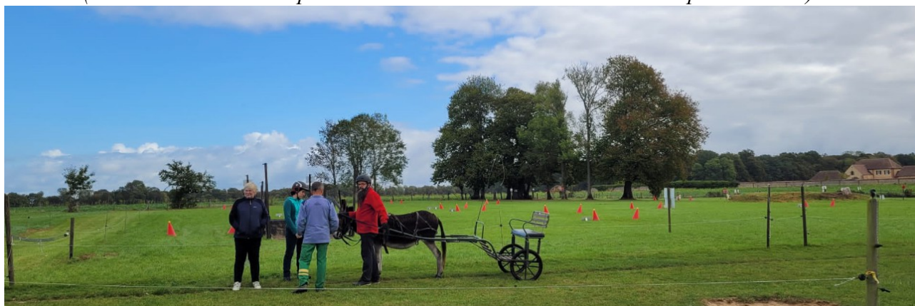
(Le parcours de maniabilité combinée avec ses arbres et ses plots)

Ensuite nous essayons d'absorber un flot de théorie équivalent au dictionnaire ( surtout pour les débutants, devenus de pauvres proies pour la migraine ) avant de prendre une bonne pause-déjeuner bien méritée.