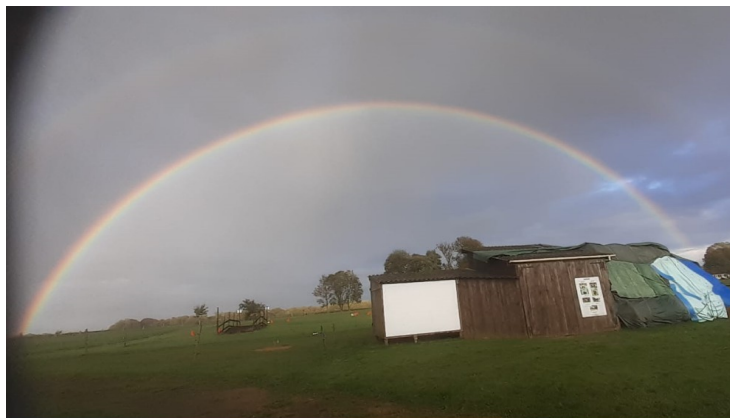
( Un arc-en-ciel : de bonne augure pour les résultats ! )

Et enfin, roulement de tambour, pendant que la pluie passe, nous rentrons à l'abri pour découvrir à quelle sauce nous avons été mangés. Mais heureusement que de bonnes nouvelles pour nous !