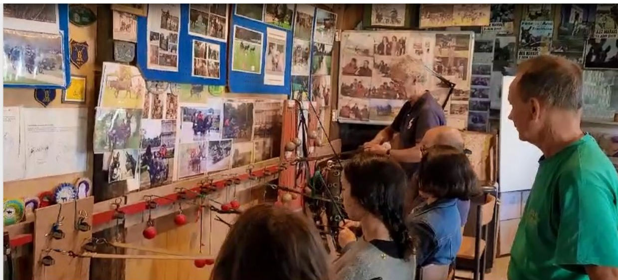
( Stagiaires à l'exercice du simulateur )

Apprentissage oblige, on nous fait subir une séance d'entraînement au simulateur, où l'enjeu principal à défaut de s'exercer, est d'éviter la cravache ( en guise de fouet ) du voisin très absorbé par les boules de pétanques.