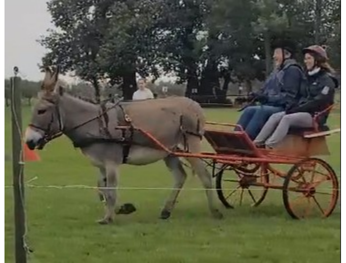
(Astro dans le dernier effort avant le poteau de l'arrivée)