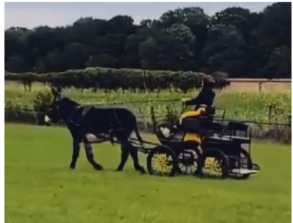
( Benny à l'arrivée dans un calme méritant)